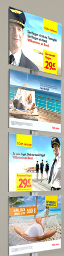
5 pixquick floor 4x A3